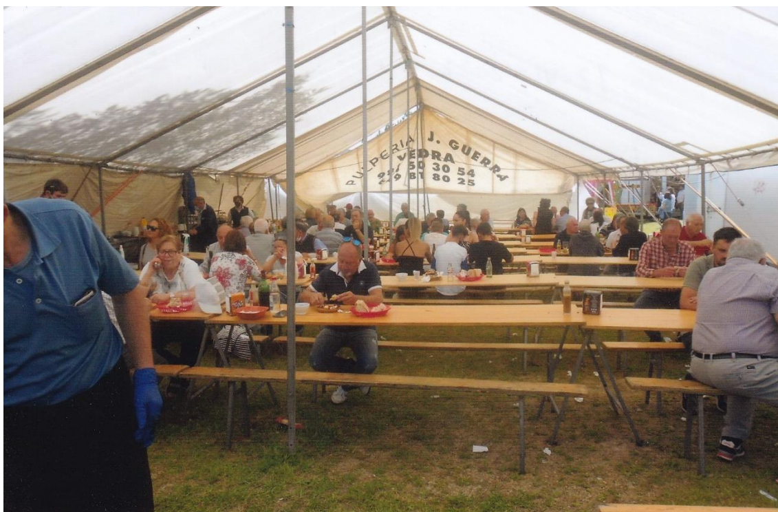
18- Posto onde se pode xantar polbo á feira e outras viandas, acompañadas de viño e outras bebidas. 12-VI-2022.