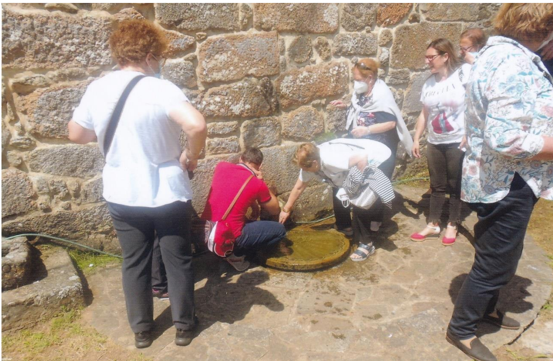
10- Devotos collendo auga da fonte. 12-VI-2022.