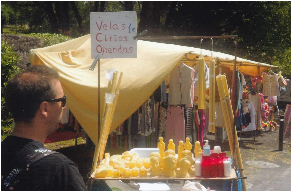
9- Posto de venda de velas, cirios e exvotos de cera. 12-VI-2022.