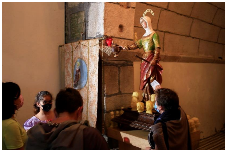
8- Un devoto tocando unha estampa na imaxe. 11-VI-2022.