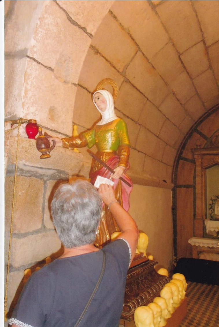
8bis- Unha devota tocando unha estampa na imaxe. 11-VI-2022.