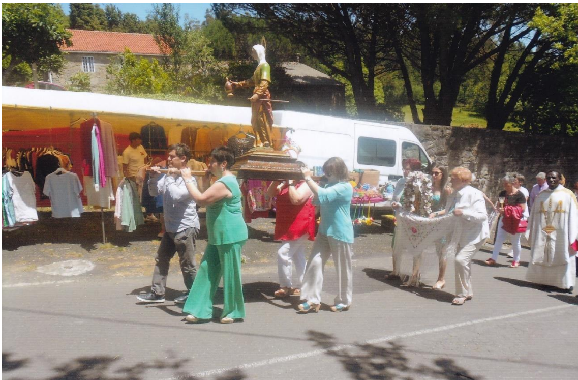
14- Santa María da cabeza levada por mulleres. Detrás o ramo. 12-VI-2022.