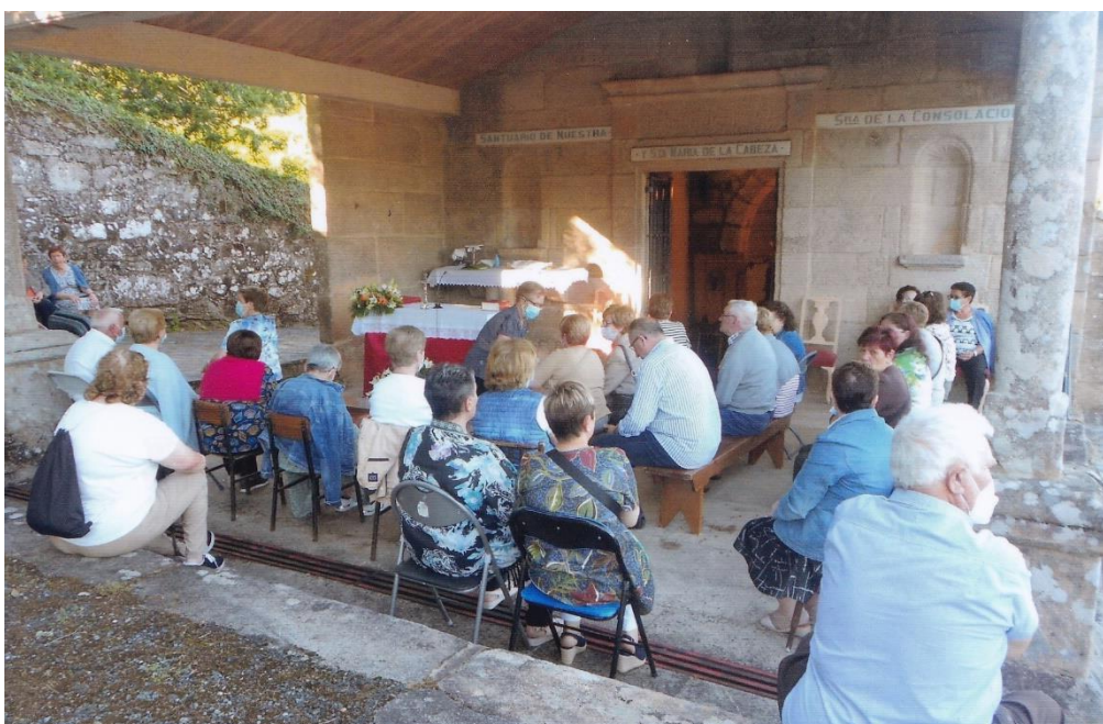
2- Fieis agardando o comezo da misa da novena , día 9-VI-2022.