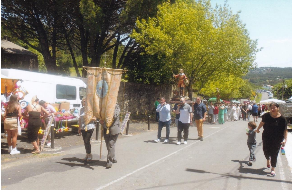
13- Procepción. 12-VI- 2022.