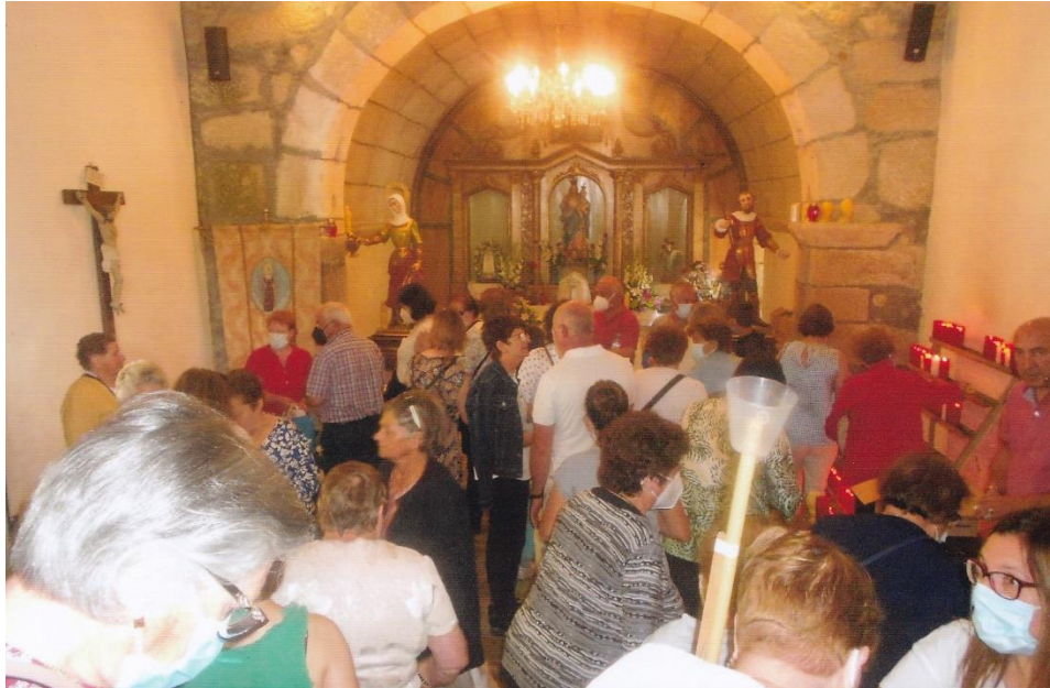
5- Devotos no interior do templo. 12-VI-2022.