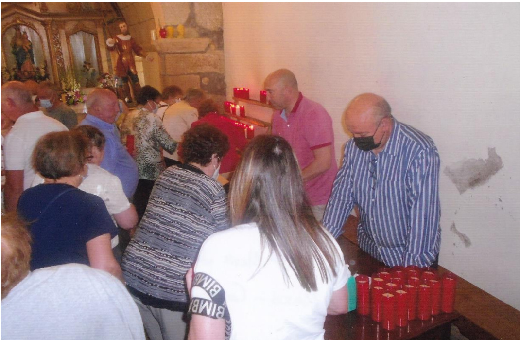
4- Adquirindo cirios e colocándoos acesos. 12-VI-2022.