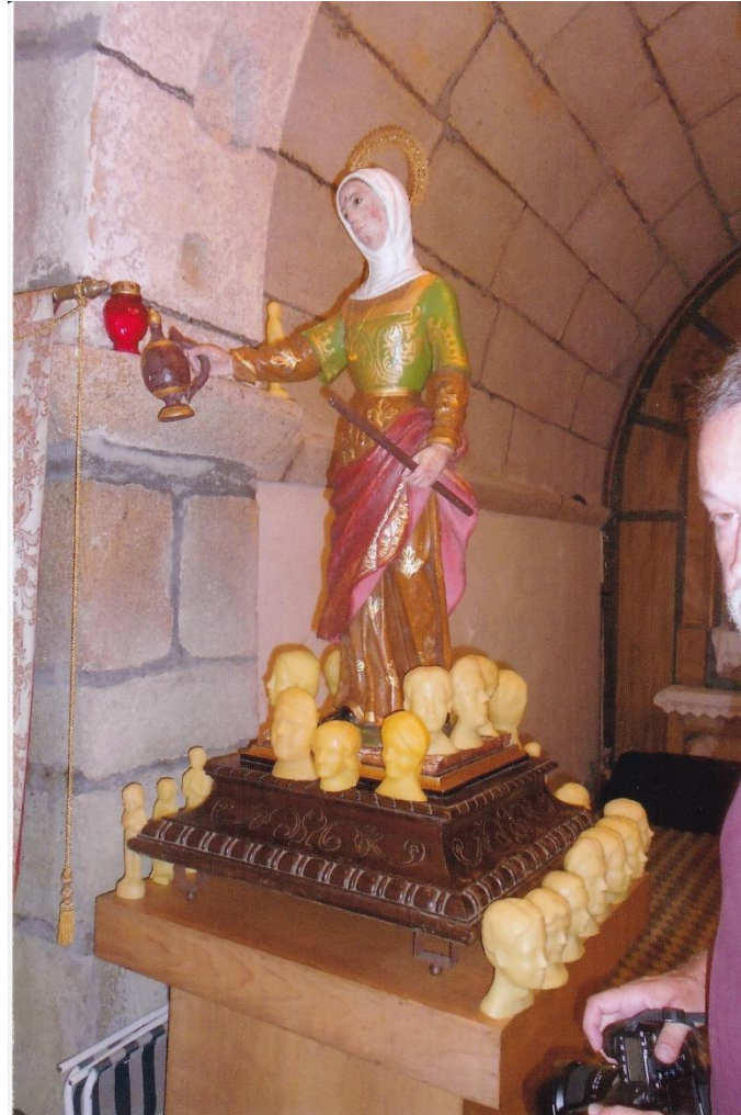
7-Imaxe de Santa María da Cabeza rodeada de exvotos de cera. 11-VI-2022.