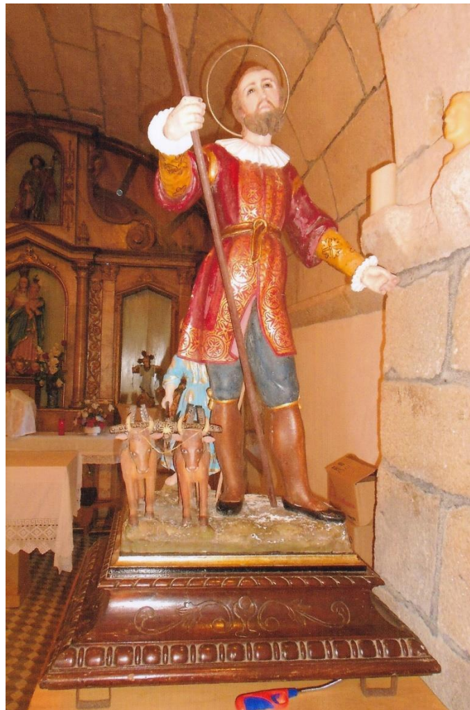
6-Imaxe da San Cidre. 11-VI-2022.