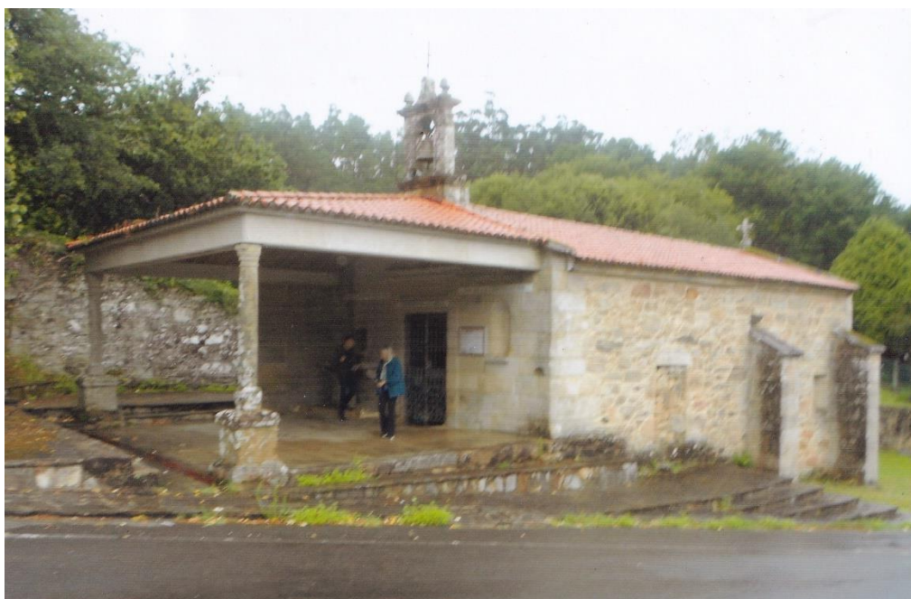
1- Vista do templo de Raxó un día ordinario.