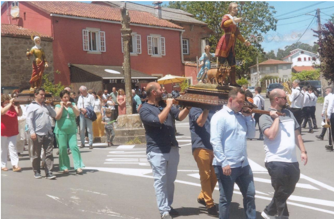
15- Procepción comezando o retorno arredor dun cruceiro. 12-VI-2022