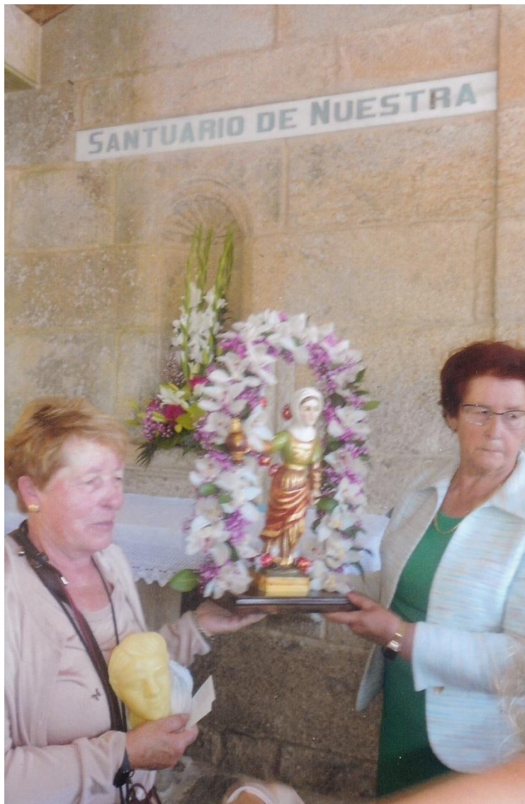
12- Vista do ramo. 12-VI-2022