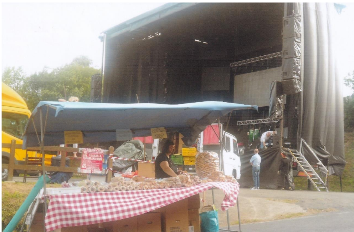
17- Posto de venda de rosquillas. Detrás, o palco onde actúan os grupos musicais. 11-VI-2022.