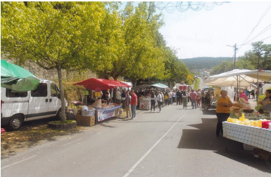
16- Postos de venda de produtos diversos. 12-VI-2022.