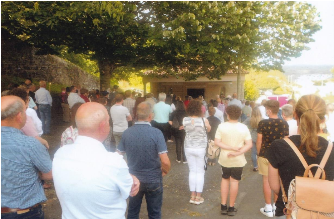
3. Fieis asistindo a misa na tarde do 11-VI-2022.